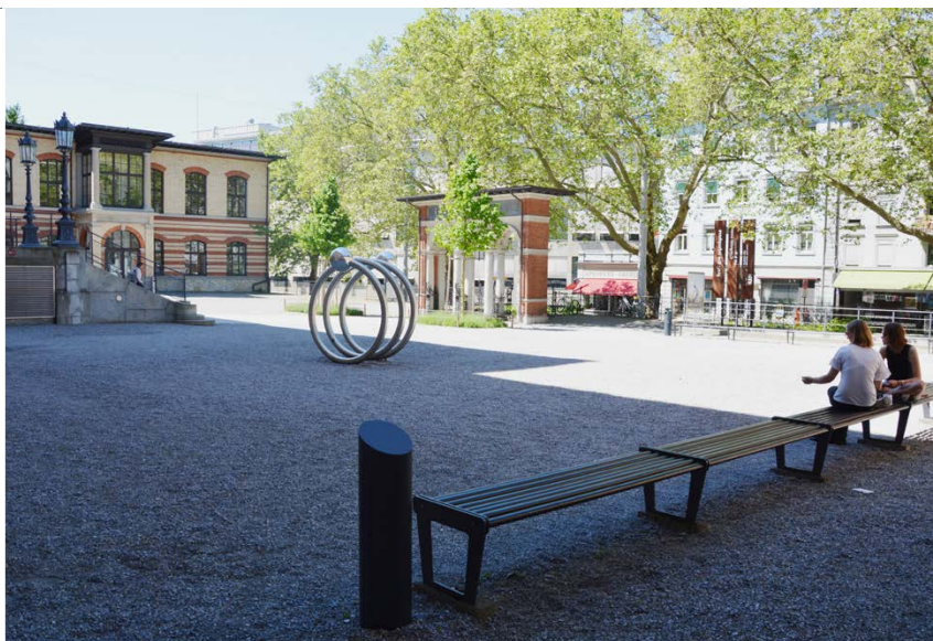
CAB Kiesplatz links

ETH Zürich Abteilung Campus Services Bewilligungen Binzmühlestrasse 130 8092 Zürich Telefon: +41 44 633 25 18 bewilligungen@services.ethz.ch